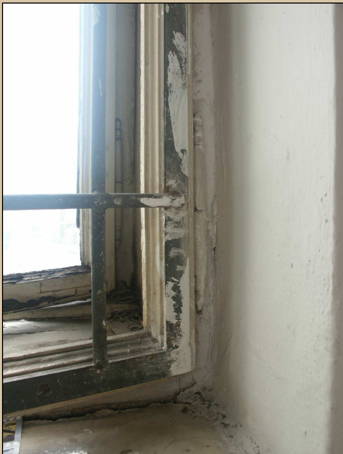
původní zapuštěné okenní závěsy