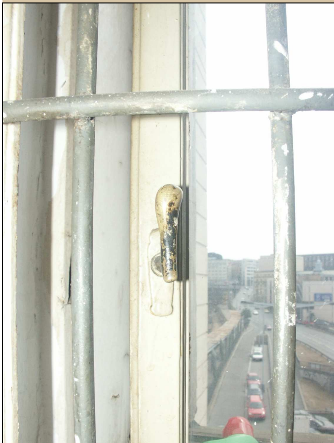
původní okenní klička