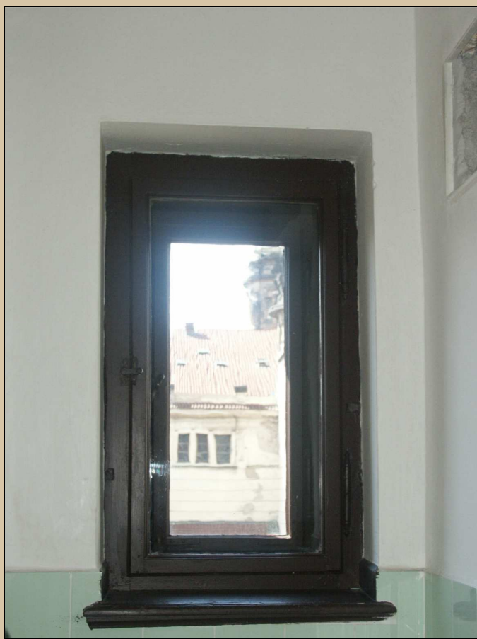
okno – celkový pohled z interiéru