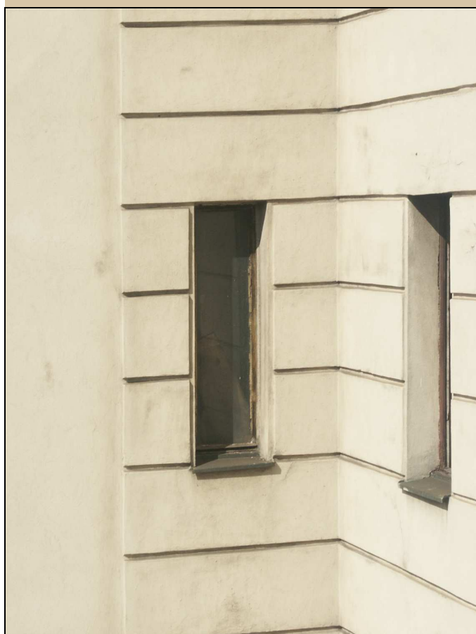
okno – celkový pohled z exteriéru

NÁVRH: repasovat, ponechat na původním místě, zachovat kličky, závěsy, zasklení (je-li historické), obnovit původní barevnost oken, bude-li zjištěna, nebo provést nátěr dle stávajícího stavu, s výjimkou kliček natřít i kování – viz stávající stav odstranit novodobou mříž Obnovit původní barevnost podle průzkumu barevnosti oken. Z interiéru obnovit bílý nátěr, z exteriéru obnovit povrchovou úpravu, shodnou jako u již rekonstruované části C. Viz technologický postup TP/118.